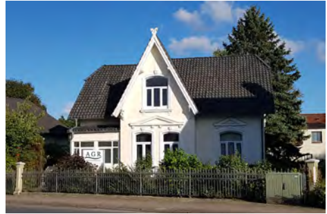
Aktion Gesunder Rücken (AGR) e. V.

→ Die Aktion Gesunder Rücken (AGR) e. V. wurde 1995 gegründet und ist ein unabhängiger Verein mit Sitz in Bremervörde (Niedersachsen). Wichtigstes Ziel ist die Förderung der Rückengesundheit. Dazu zeichnet die AGR besonders rückengerechte Produkte mit dem AGR-Gütesiegel aus. Zudem schult die Aktion Gesunder Rücken auch Fachhändler und Therapeuten zum Thema Ergonomie und Rückengesundheit und arbeitet eng mit unabhängigen Experten zusammen. Der Verein bereitet aktuelle Daten und wissenschaftliche Erkenntnisse verbrauchernah auf und unterstützt die Forschung zur Vermeidung von Rückenschmerzen. Die AGR versteht sich als erste Anlaufstelle bei Fragen rund um das Thema Rückengesundheit, Schmerzursachen und deren Vermeidung sowie Therapiemöglichkeiten.